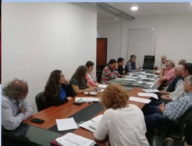
Reunión de la Comisión Fitosanitaria Mixta de Catamarca