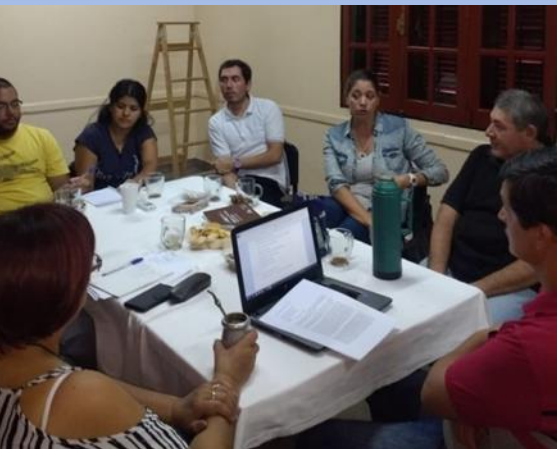
Reunión con Profesionales: Ing.de Paisajes y Téc. Parques de Jardines