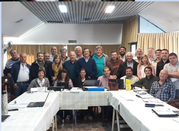
Renovación Autoridades de la Federación Argentina de Ingeniería Agronómica FADIA